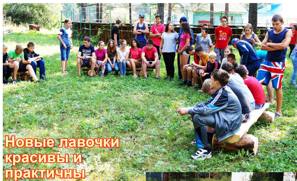
Новые лавочки красивы и практичны