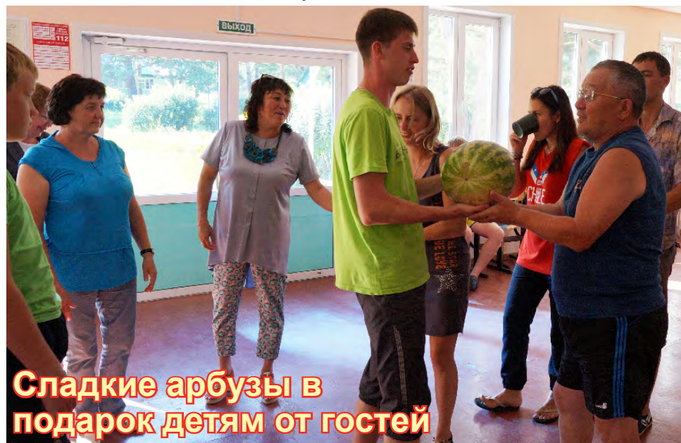
Сладкие арбузы в подарок детям от гостей