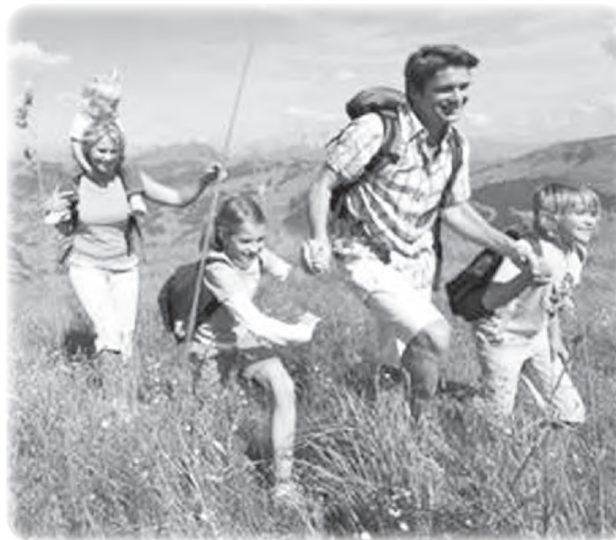
Помните, что вы – лучший пример своим детям.

Помните, что вы – лучший пример своим детям. Я сам начал курить, потому что