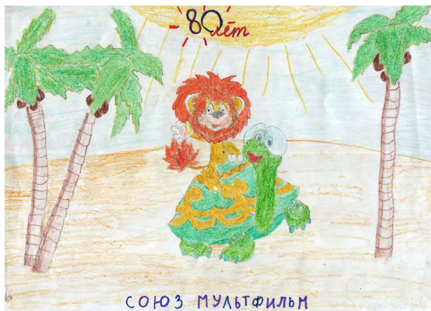
Дорошенко Катя, 10 лет