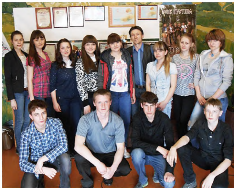
входят ребята и с музыкальным образованием и без него. За время обучения в группе все участники пробуют играть на раз-